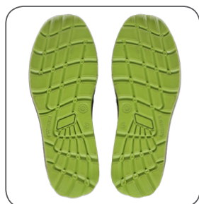
podešev outsole podeszwa